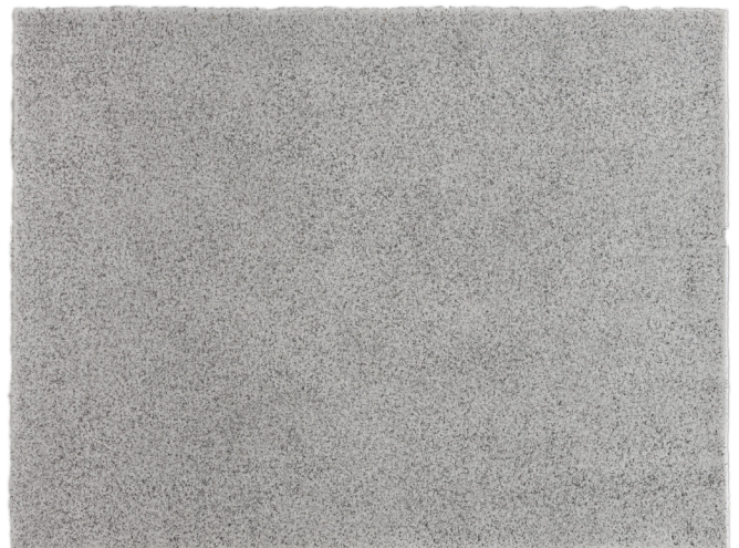
7《無題》2018年 | 鉛筆・ニードル、紙 | 19.0×25.0cm

区民割引:目黒区在住、在勤、在学の方は受付で証明書類をご提示いただくと団体料金になります(他の割引との併用はできません)。