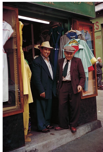
木村伊兵衛 パリ (1954-55 年) ©Naoko Kimura