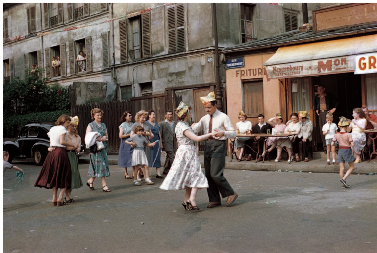
木村伊兵衛 職人町のパリ祭、メニルモンタン、パリ (1955 年)