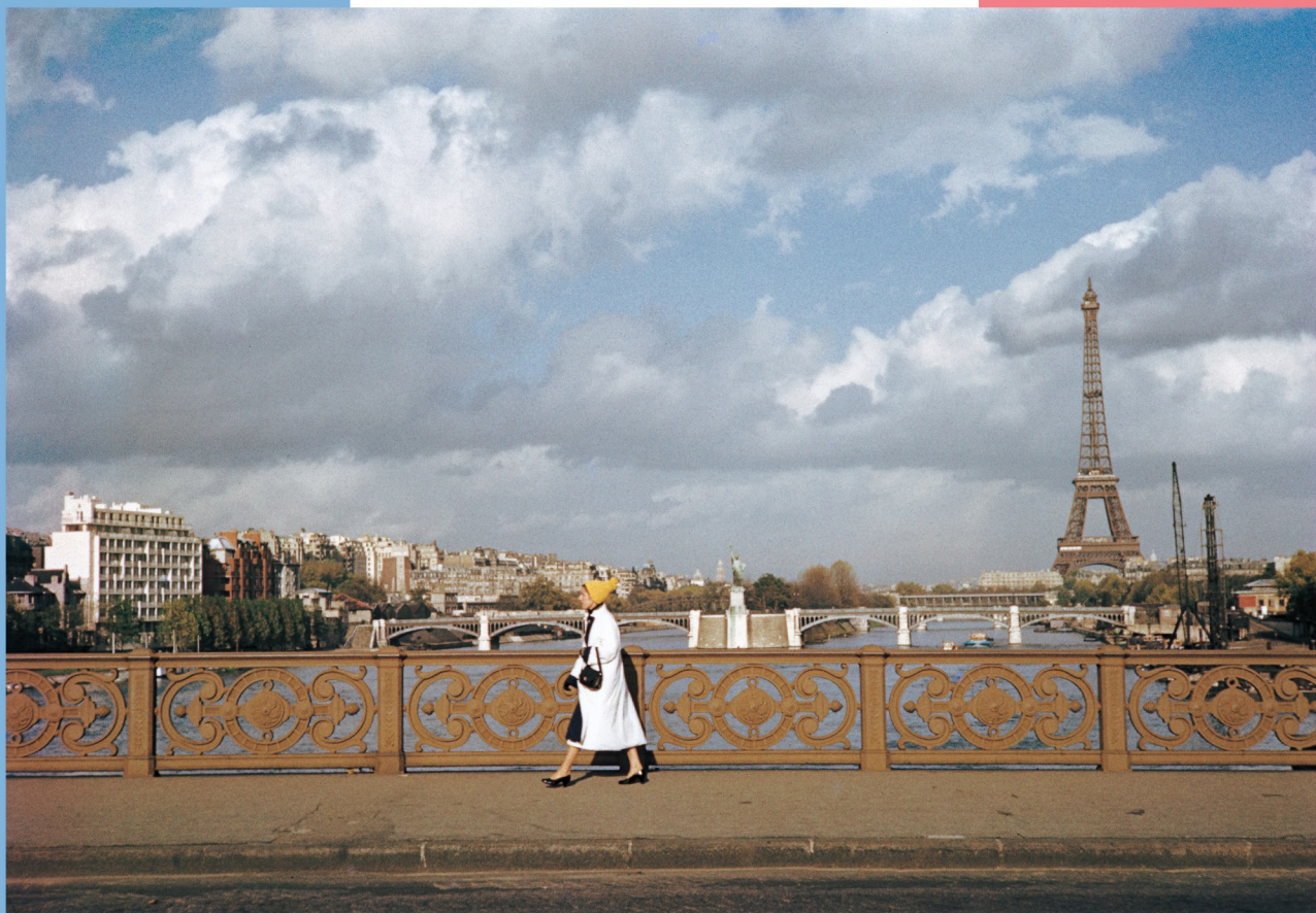
木村伊兵衛 ミラボー橋、パリ (1955年)