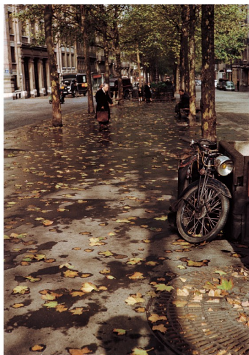
木村伊兵衛 パリ (1955 年)