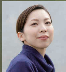
© 前澤秀登 演出：中村 蓉 Stage Director: Yo Nakamura