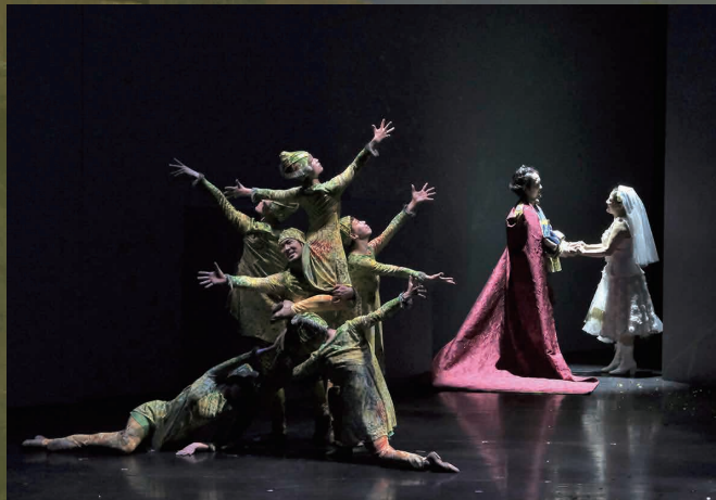
2021年5月 二期会ニューウェーブ・オペラ劇場公演「セルセ」より 指揮：鈴木秀美 演出：中村 蓉

装置：原田 愛 Set Designer: Ai Harada 衣裳：田村香織 Costume Designer: Kaori Tamura 照明：喜多村 貴 Lighting Designer: Takashi Kitamura