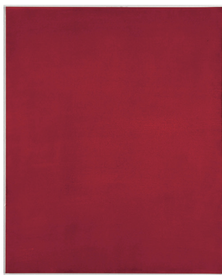
《無題》 1980 透明水彩 / 紙 62.5×50.7 cm