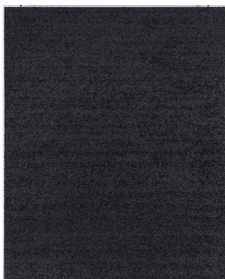
《無題》 1998・1999 油彩 / キャンバス 100号 162.0×130.0 cm