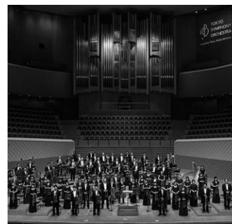
東京交響楽団 Tokyo Symphony Orchestra

1946年、東宝交響楽団として創立。1951年に東京交響楽団に改称し、現在に至る。サントリーホール、ミュージアムシビックホール、東京オペラシティコンサートホールで主催公演を行うほか、川崎市、新潟市、八王子市などの行政と提携し、コンサートやアウトリーチを積極的に展開している。また、新国立劇場のレギュラーオーケストラとして毎年オペラ・バレエ公演を担当。海外公演も多く、これまでに58都市で78公演を行ってきた。