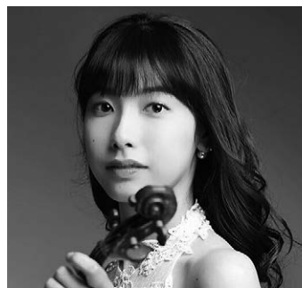
荒井里桜 (ヴァイオリン) Rio Arai, Violin

国内では94年以来、東京交響楽団と密接な関係を続け、現在は正指揮者。03年、NHK交響楽団定期演奏会にマーラーの交響曲第1番でデビュー。06年度 芸術選奨文部科学大臣新人賞を受賞、07年より山形交響楽団音楽監督に就任。2014年シーズンから日本センチュリー交響楽団首席指揮者に、2019年シーズンより山形交響楽団芸術総監督に就任。