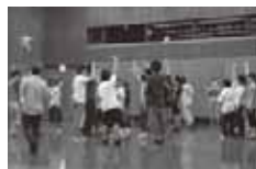
入門ワークショップ

日時 | 6月23日(日)実施 講師 | 平田オリザ(劇作家・演出家) 対象 | 中学生・高校生