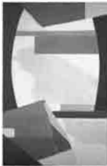
《雲と子供》岡田謙三 1966年

本展では、目黒をキーワードに目黒ゆかりの作家やデザイナーの作品を取り上げます。出品作家は、岡田謙三をメインに、古茂田守介、荻須高德、海老原喜之助ほか。