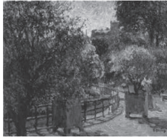
安井曾太郎「パリの公園」1911年 油彩・キャンバス、目黒区美術館蔵

目黒区美術館の作品収集方針に沿った「海外で学んだ画家たちとその作品」のうち、戦前・戦後のパリを取り上げ、二部構成によりご紹介します。本展はその第一部。第一次世界大戦前夜の1910年頃から1940年頃まで、パリを舞台に研鑽をつみ、時に脚光を浴びた日本人たちの足跡を思い起こします。