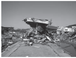
2011年4月5日、気仙沼市仲町の状況。JR南気仙沼駅のホーム。

本展は、目黒区の友好都市、宮城県気仙沼市にあるリアス・アーク美術館が平成25(2013)年4月に公開した常設展示「東日本大震災の記録と津波の災害史」展を東京地区で初めて大きく取り上げるものです。被災地域の復旧と復興への活用のため、同館が震災直後から約2年をかけて撮影した被災現場の写真を中心に、一部の「被災物」をあわせて紹介します。震災から5年、本展を通じて震災の記録を見直すことで、地域や世代を超えて、その記憶を更新/形成させ、考えていく一助となることを目指します。