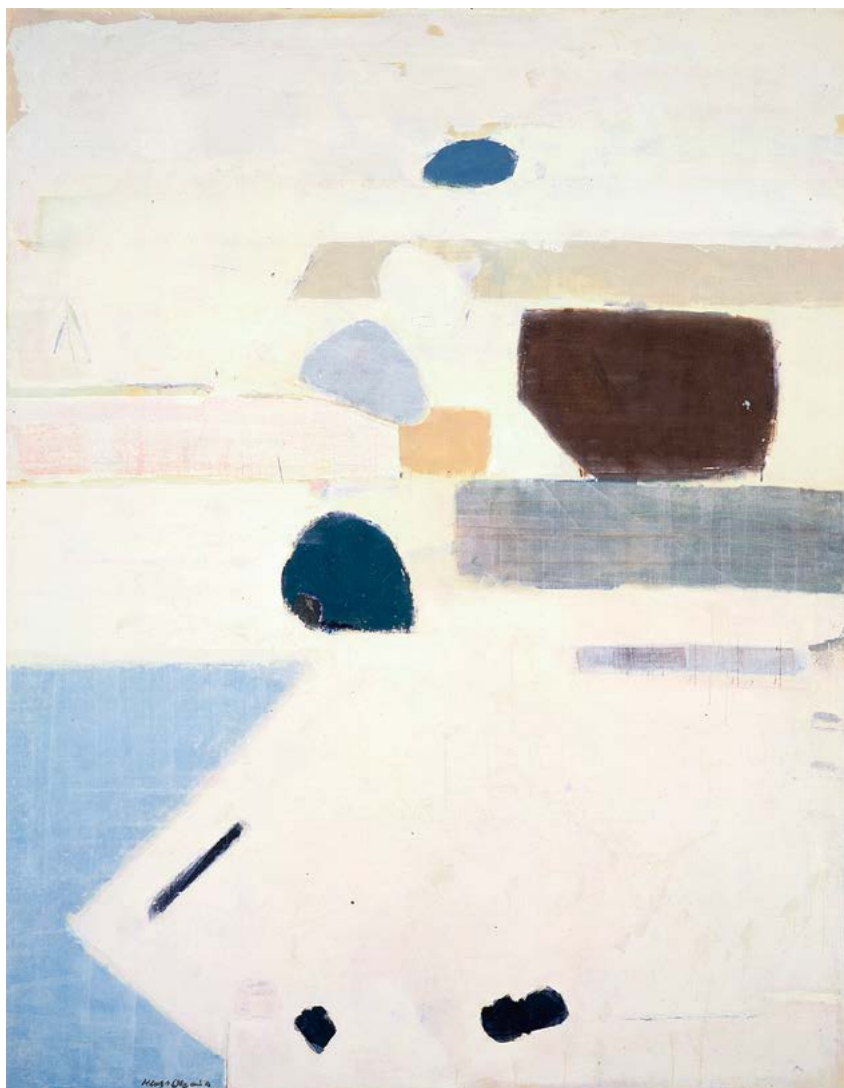
《間隔》1958年 油彩・キャンバス 220.5×172.5cm 目黒区美術館

岡田は、東京美術学校（現 東京藝術大学）入学から約2年後の1924年にパリへ渡ります。第一次世界大戦終結により、世界各国から芸術家が集い、活気に満ちたパリでの日々は、若き日の岡田にとって全てが新しく、視野の広がる経験となりました。モンパルナスのカフェなどに集まって議論していた芸術家たちの仲間に加わり、後に確立する抽象的な作風の基礎となる考え方にも触れ、さながら「心の訓練のようだった」と振り返っています。1927年の帰国後は、戦前から戦後にかけての時代のうねりの中で、これまで培ってきた技巧や様式から離れ、新たに実験の日々を積み重ねていきます。戦後早々に見据えていた渡米を1950年に実現させると、ニューヨークでは抽象表現主義の画家と交流を持ちながら、やがて、淡い色面を組み合わせる独自の作風を確立させました。自身の根源的な感性への回帰の中に築き上げた静謐で力強い表現は、パリとニューヨーク、そして目黒のアトリエでの模索の日々を抜きに語ることはできないでしょう。本展は、岡田の画風の変遷を三つの都市での経験からたどります。