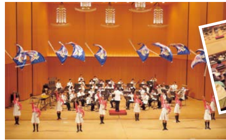
2024年 「避難訓練コンサート」の様子