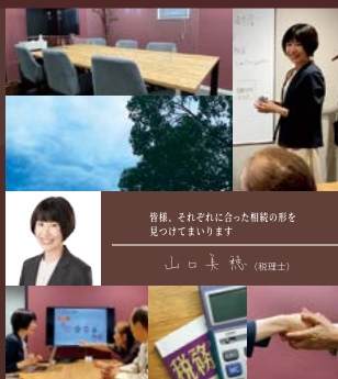
皆様、それぞれに合った相続の形を 見つけてまいります