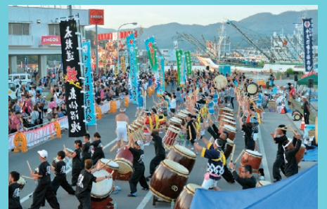
気仙沼みなとまつりの風景

そして今回、気仙沼で親しまれてきた名曲をジョイントコンサートのために新たに編曲し、お祭りの活気と共にお届けします！吹奏楽サウンドで響かせる「海潮音」にご期待ください！