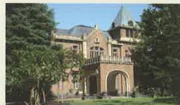
旧前田侯爵邸(洋館)

【申し込み】 締切り:9月24日(火)必着 (応募多数の場合は抽選) 詳細は裏表紙下部へ