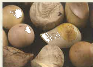
木の玉《そのときのきもち》横尾哲生