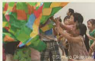
2013 夏のワークショップより